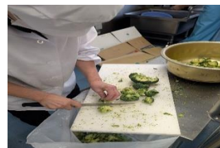
調理員さんが食べやすい大きさにカットします