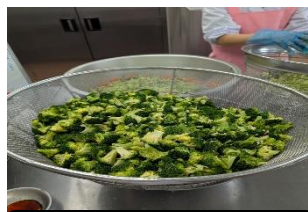
回転釜で茹でたら、冷ましてからサラダにします