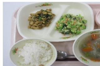
ノンエッグマヨネーズ、しょうゆ、砂糖と絡めていただきました