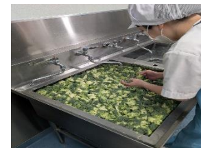
カットしたものを水槽で3回、丁寧に洗っていきま