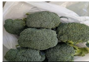
大きくておいしそうな新鮮なブロッコリーです

ふかや園芸協会様より、深谷産の新鮮なブロッコリーを10kgも無償でいただきました！！ふかや園芸協会とは、深谷市内の野菜農家を中心となった約600名のグループです。2月の献立「冬野菜のごまマヨあえ」でおいしくいただきました。